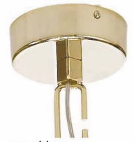
oro chiaro light gold

Telaio in metallo cromato o oro chiaro Elementi in cristallo molato disponibili nelle seguenti varianti colore: